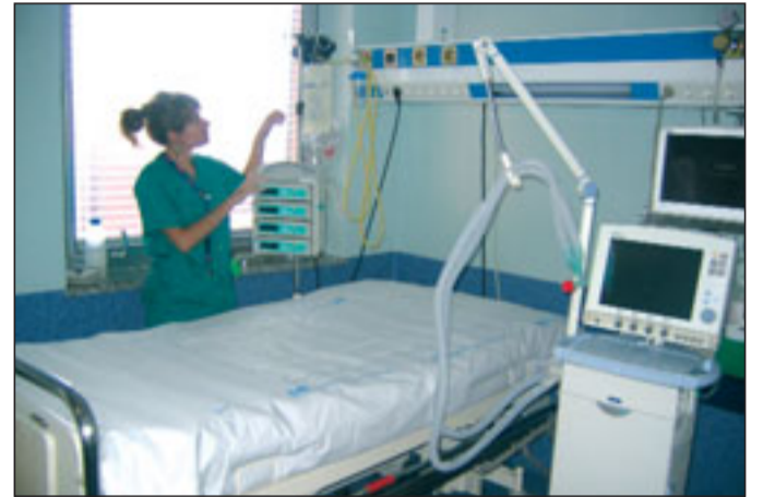
En la fotografía, uno de los boxes para la atención de los pacientes que son ingresados en la UVI Polivalente, tras la reforma

Actualmente, sobre la cabecera de la cama de cada paciente se ubica la instalación de gases, enchufes, sistema de voz y datos, iluminación con regulación de intensidad y soporte para instrumentos. Este tipo de instalaciones suspendidas y no fijadas al suelo permite en la práctica la liberación de espacios y un mejor orden en el entorno inmediato del paciente. Además, cada uno de estos puestos está caracterizado por su seguridad eléctrica, gracias a la colocación de un panel de aislamiento con repetidor de monitor de fugas.