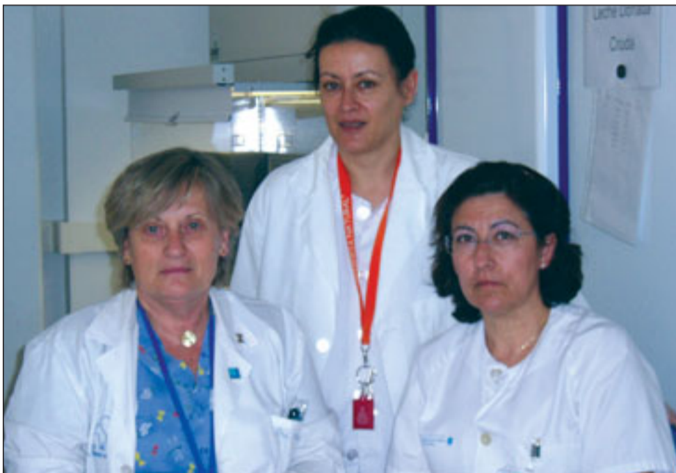
En la foto, las profesionales que trabajan en el Banco de Leche Humana de Neonatología.