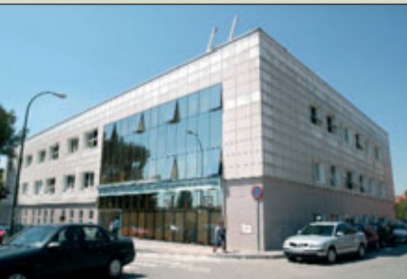
LÍNEA 8: CEP de Villaverde.