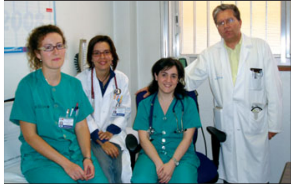
Profesionales del Hospital que han participado en el estudio multicéntrico.

Del total de casos, 52 recibieron tratamiento con esteroides, mientras que a nueve no se les suministró. De los 52 que sí lo recibieron, 28 recuperaron su función renal completa, con un retraso en la administración de esteroides de 13 días; sin embargo, los 24 restantes no llegaron a