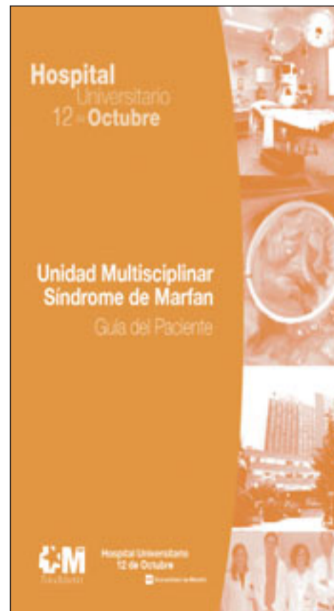
Guía para el paciente de la Unidad de Síndrome de Marfan.

dad multidisciplinar en España para el diagnóstico, seguimiento y tratamiento integral de los pacientes con síndrome de Marfan. Está formada por especialistas del Servicio de Cirugía Cardiovascular que trabajan en colaboración con Cardiología, Oftalmología, Traumatología y Genética. Concentrar la experiencia en una enfermedad rara como el síndrome de Marfan es fundamental para mejorar los resultados de las intervenciones quirúrgicas complejas y aumentar las expectativas de vida de estos pacientes. El diagnóstico es complejo, requiriéndose múltiples pruebas y valoración por diferentes especia-