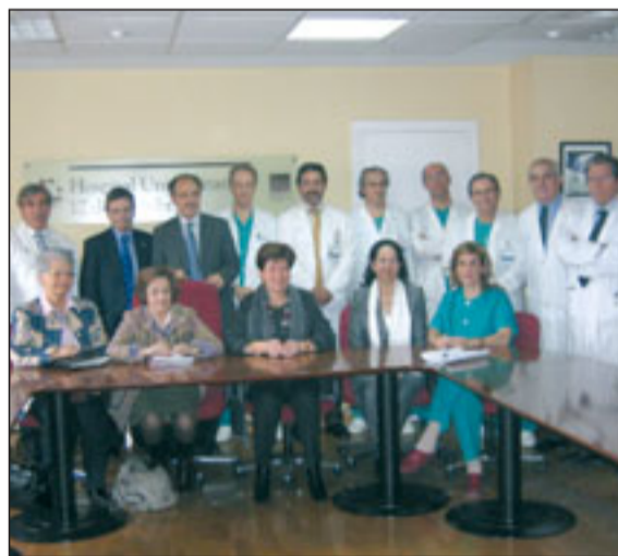
Los europarlamentarios que visitaron el Hospital se hicieron una fotografía de recuerdo junto a representantes de los profesionales que participan en el programa de trasplante.

Los resultados del estudio son especialmente útiles para la práctica clínica diaria, ya que si los esteroides son administrados rápidamente producen una mejoría general de la función renal en los pacientes afectados por esta enfermedad. Además, este tratamiento farmacológico es sencillo y, sin embargo, provoca un beneficio claro, tanto para el paciente como para el propio centro sanitario en el que son tratados.