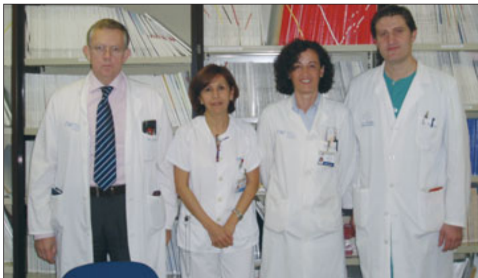
Algunos de los profesionales de la Unidad Multidisciplinar para el tratamiento del Síndrome de Marfan.

A los pacientes seleccionados se les asignará la medicación correspondiente de forma aleatoria, de modo que la probabilidad de recibir un fármaco u otro sea del 50 por ciento. El estudio será doble ciego, ni pacientes ni investigadores conocerán los fármacos administrados en cada caso. La inclusión de pacientes se