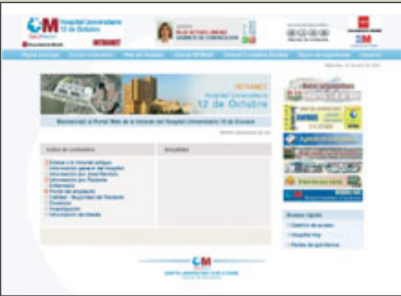
LÍNEA 6: Pantalla principal de la nueva Intranet.