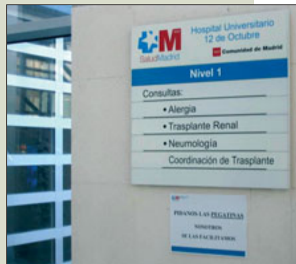
LÍNEA 13: Carteles informativos para agilizar la recogida de las pegatinas.

A fecha de hoy, la espera habitual en Admisión para recoger pegatinas ha desaparecido prácticamente. La mayoría de los Servicios las facilitan directamente. Para dar a conocer esta posibilidad, se colocaron en muchos puntos del Hospital carteles informativos.