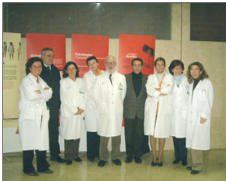
Los responsables de la exposición junto al Director Gerente del Hospital.

La Fundación para el Desarrollo de la Enfermería ha organizado en el Hospital una exposición que, bajo el título “La salud de las poblaciones con menos recursos”, desglosa los principales problemas de salubridad en el mundo, tales como la mortalidad infantil y materna, VIH, paludismo, tuberculosis, factores ambientales o acceso a medicamentos esenciales. Patrocinada por la Agencia Española de Cooperación Internacional para el Desarrollo (AECID), consta de 14 paneles que recogen fotografías, gráficos y textos sobre la situación de las personas de los países