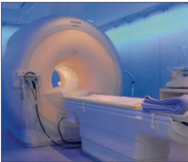
Modelo de Resonancia Magnética Nuclear con sistema de luz ambiental.

La nueva resonancia magnética será la única con este sistema en un hospital público español, aunque ya funciona en algunos centros privados. El sistema de luz ambiental hace posible que los pacientes estén más tranquilos y, además, puede llegar a convertirse en una herramienta de comunicación con otro tipo de personas, como los que presen-