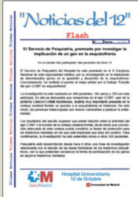
LÍNEA 10: Flash Noticias del 12.

El Hospital cuenta ya con un número importante de instrumentos que facilitan la comunicación interna, como las comisiones de objetivos que mejoran la participación de los profesionales en el funcionamiento del Centro, las normas internas de funcionamiento, la propia Intranet, las notas informativas El 12 Informa y el boletín Noticias del 12 –sólo dos hospitales de la Comunidad de Madrid, incluido el nuestro, editan una publicación de este tipo-. Ade-