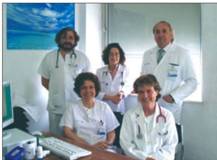
Algunos de los profesionales de la Unidad de la Vía Aérea.

El análisis se ha realizado a partir de pacientes tratados en la unidad en el periodo 1990-2007 que precisaron decanulación quirúrgica, analizando las variables de sexo,