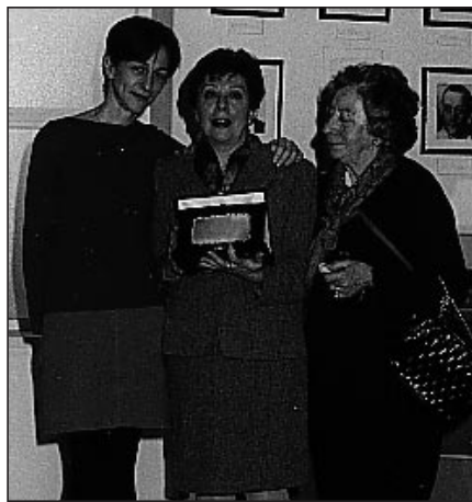
Abuela, madre e hija posaron para el periódico del Hospital.