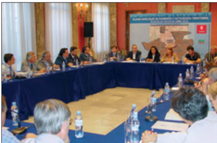
Presentación del Plan Especial en la Junta Municipal de Puente de Vallecas, a la que asistieron tres de las cuatro asociaciones de vecinos.

El proceso de concertación que acaba de iniciarse es, sin duda, un proceso complejo, cuyo éxito depende del esfuerzo de diálogo que hagan todas las partes implicadas, para que llegue a buen fin. No obstante y pese a esta complejidad, el Ayuntamiento de Madrid está dispuesto a no escatimar esfuerzos para la elaboración y aprobación de los Planes Especiales de Inversión 2008-2012 de Villa de Vallecas y Puente de Vallecas, desde el convencimiento de que los mismos contribuirán de forma más que significativa a avanzar en el reequilibrio de estos Distritos y a mejorar la calidad de vida de sus habitantes y todo ello con una metodología eminentemente participativa.