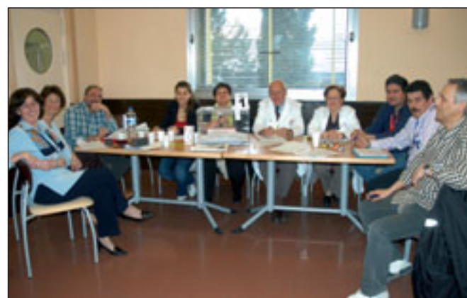
Tres imágenes de la jornada electoral celebrada el pasado 28 de febrero para elegir a los representantes sindicales del Área 4.