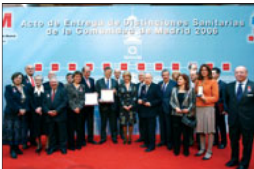
Al finalizar el acto, los galardonados posaron junto a la Presidenta de la Comunidad de Madrid, Esperanza Aguirre.

La Comunidad de Madrid ha entregado las Distinciones Honoríficas de la Sanidad Madrileña correspondientes al año 2006, con las que el Gobierno regional reconoce acciones de personas, instituciones y organizaciones que han destacado de manera singular en el desempeño de sus funciones.