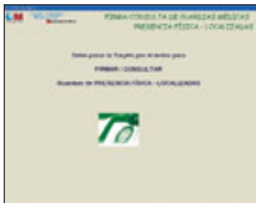
Pantalla inicial de acceso a la página de gestión de las guardias.