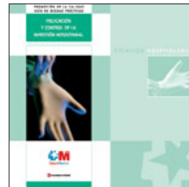
Portada de la guía dedicada a la infección nosocomial.

La infección, tanto comunitaria como hospitalaria, sigue siendo una de las complicaciones más frecuentes y costosas a las se enfrenta el sistema sanitario. Aunque existen procedimientos y métodos simples que nos permiten abordar su prevención y control, el cumplimiento del objetivo de prevenir y controlar la infección es permanente en los hospitales.