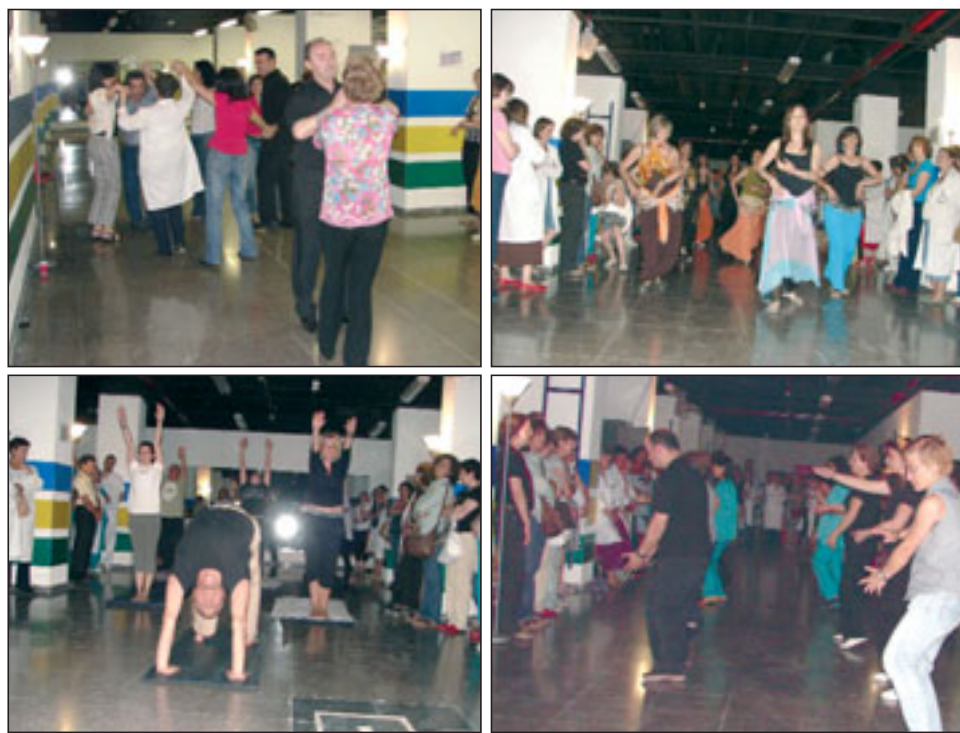
Algunas de las actividades realizadas por los grupos de participación. Arriba, de izquierda a derecha, baile y danza del vientre. Abajo, grupos de yoga y tai-chi.

La Unidad de Participación de Recursos Humanos ha cerrado el primer semestre de actividades desde que se inauguró el local de la planta -5. Por él han pasado más de 400 personas que han recibido clases semanales de Tai-Chi, Danza Oriental, Bailes de Salón, Yoga y Ritmos Latinos, con un objetivo común: mejorar su salud, su ánimo, su disposición frente al reto del día a día... y reírse juntos. No en vano, el lema de esa Unidad es "Cuidándonos, cuidamos mejor".