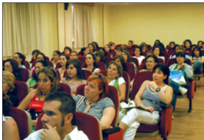
Sesión de incorporación de los nuevos compañeros de Enfermería.

Ya se han incorporado al hospital los 209 enfermeros y 176 auxiliares de Enfermería que cubrirán las plazas de verano. De ellos, 121 enfermeros y 72 auxiliares de Enfermería son de nueva incorporación. La Dirección de Enfermería del hospital ha organizado una sesión docente para que conocieran el funcionamiento del centro sanitario.