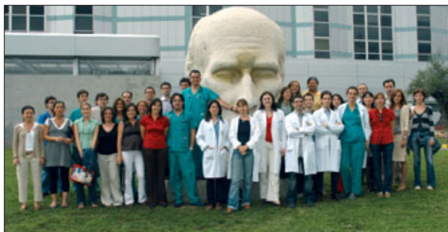
Foto de familia de los residentes.