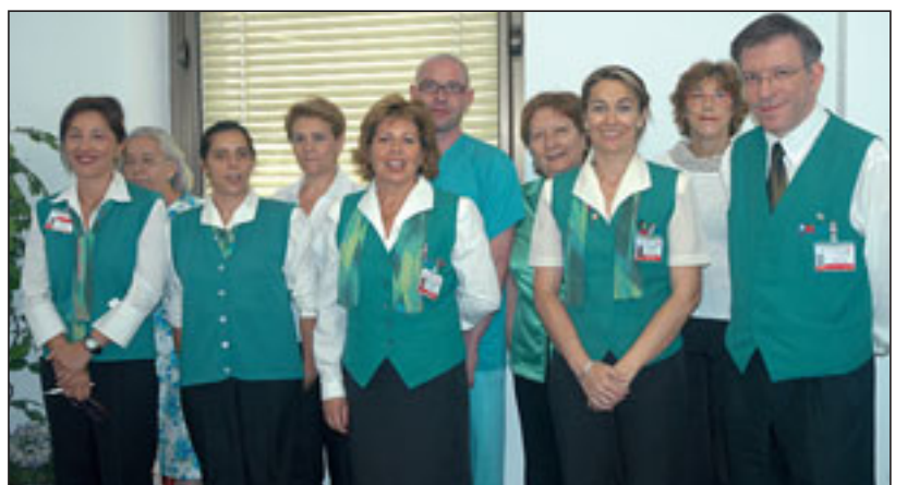
Miembros del equipo de informadores.

Su lema ¿En qué le puedo ayudar? encierra toda una actitud