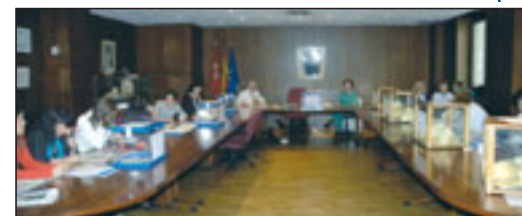
Elecciones a vocales de la Junta Técnico Asistencial el pasado 24 de noviembre.