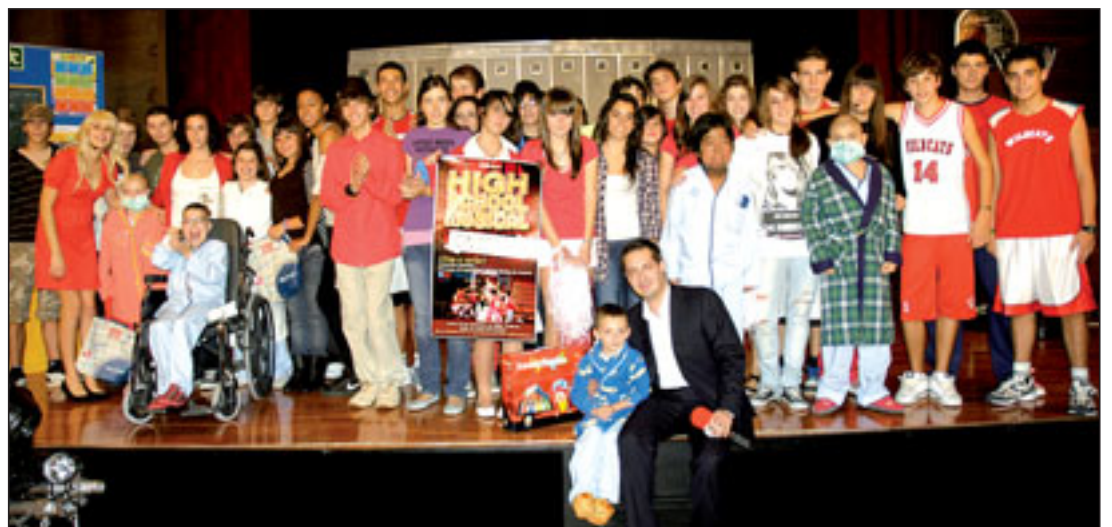
Los actores junto a algunos de los enfermos que acudieron a la representación.

Los 30 alumnos del Grupo de Teatro de 2º de E.S.O del Colegio Bristol de Madrid actuaron gratuitamente el lunes 23 de noviembre en el Salón de Actos, interpretando la obra High School Musical. Los pacientes, acompañantes y trabajadores que pudieron bajaron a la representación; también se pudo seguir la actuación por el circuito cerrado de televisión. Este Grupo de Teatro Bristol han actuado ya -a beneficio de la ONG Entreculturas- ante más de 8.000 personas en su gira por Madrid y Jaén. Este colegio se ha ofrecido a representar más adelante otro musical.