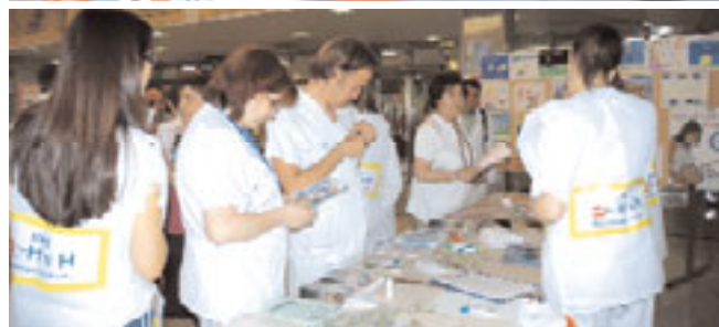
Los representantes de los hospitales o centros distinguidos por las certificaciones de HsH posan junto al adhesivo que prohíbe fumar en la entrada de las consultas de Oncología Médica. Abajo, profesionales del hospital recogen folletos en la mesa del Día Mundial sin Tabaco.